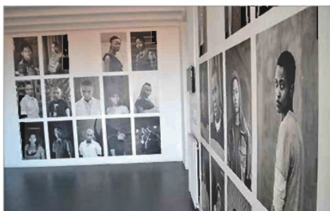
■ Zanele Muholi, la star du cycle d'expositions.

Le droit à la différence dépasse la question de genre. Pour Beauté réelle , Jodi Bieber fait poser en petite tenue des femmes dont les corps échappent aux canons des magazines de mode. Dans un univers quotidien, ces femmes se présentent