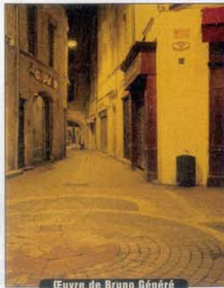
Œuvre de Bruno Généré

Evidemment comme nous sommes dans la cité gardoise nous sommes curieux de savoir quel regard est porté par les photographes nîmois sur la vie nocturne à Nîmes. Ce dont s'occuperont les sept membres du collectif Regards sur la ville (jusqu'au 8/01/2010). Bruno Généré s'intéresse à l'éclairage urbain, jaunâtre, des petites rues du centre ville, Claude Corbier à la maison carrée ou la tour de l'horloge hantée par des fantômes, Jean-Louis Escarguel à des natures mortes, prises dans l'espace du dedans. Enfin, le 4 décembre auront été projetées les images de Nuits du trio du Bar Floréal, Sophie Carlier pratiquant une sorte de journal où la nuit occupe une place non négligeable ; André Lejarre célèbre les travailleurs de la nuit, ceux qui œuvrent quand nous nous reposons ; Nicolas Quinette présente un monde intime marqué par la présence du flou qui désigne le mouvement. Une belle brochette qui nous rappelle combien la nuit a toujours inspiré les artistes et les poètes, de Rembrandt à Lautréamont, de Van Gogh aux surréalistes en passant par Lautrec et Aloysius Bertrand, le prodigieux auteur de Gaspard de la nuit précisément et qui chante quelque part, dans ses poèmes en prose, La nuit et ses sortilèges.