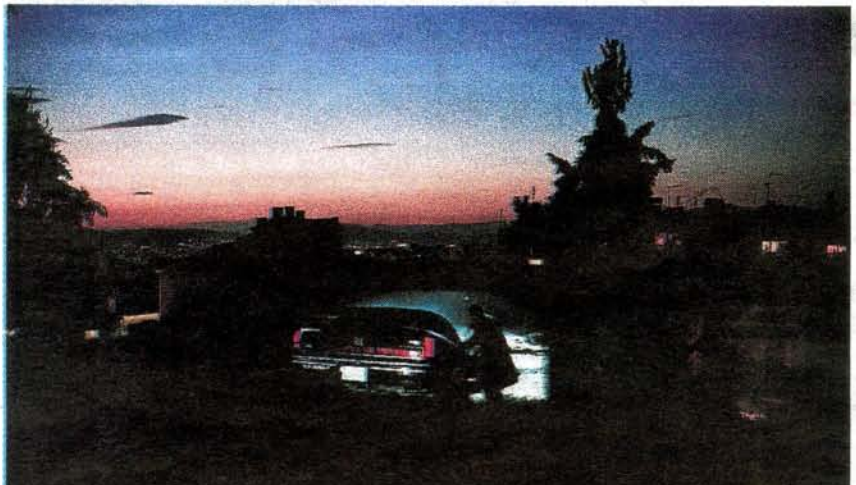
De façon très cinématographique, Patrick Zachmann explore la nuit en jouant avec les lumières, les couleurs, les atmosphères.