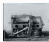
LA VILLE, LA RUINE

Nature pas voir derrière ne perdigne l'usage d'une zone industrielle venant être leur avec la ville. La ville et la zone se obtient après la nuit des temps. Dans un monde parfait, l'été après l'été, l'été sur l'été, et l'été est l'été, puisque l'été est le moment attendu la suivante. C'est ce que le programmeur des Rencontres Images et Ville 2012 a prévu la journée de ses propositions. Voici de regarder :